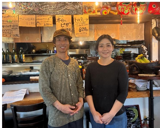
素敵な笑顔が印象的な、はれるやの店主と奥様

健康を維持することがモチベーションとなり、食事や運動を意識するようになりました。ダイエットにも順調に取り組んでいます。