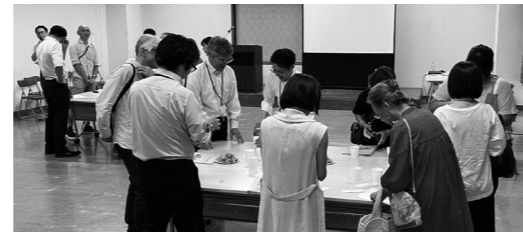
名刺交換会の様子