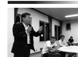
西理事のあいさつ