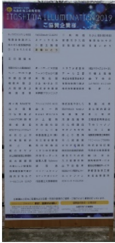
協賛者・協賛企業一覧看板