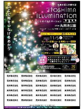
②A3サイズポスター ポスター下部に掲載予定