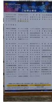
①協賛者・協賛企業一覧看板