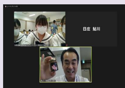
開発に携わった学生とにこやかに商談