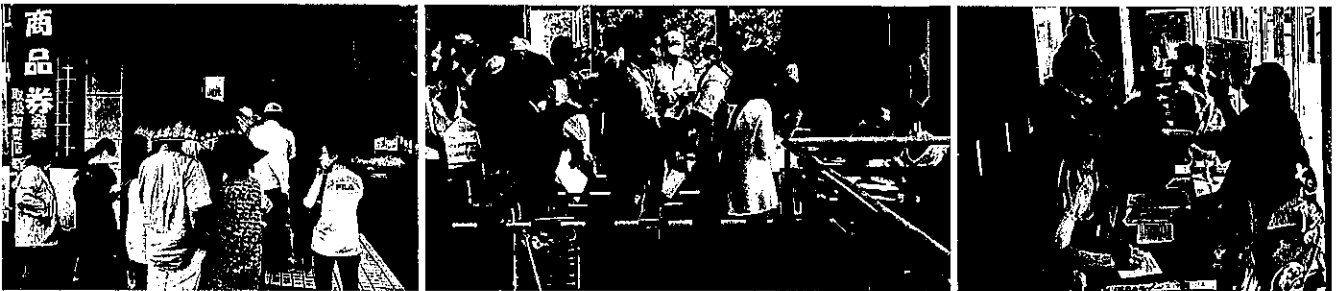
8/31発売初日の販売の様子

8月31日(日)から販売を開始したプレミアム付商品券(リフォーム商品券を含む)が10日間で完売致しました。ご購入いただきました皆様には、心より感謝申し上げます。使用期限・換金期限にはご注意ください。