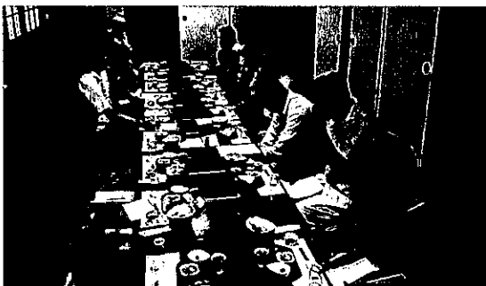
地区役員と青年部・女性部懇談会の様子

パートタイム労働法に関するお問い合わせは、福岡労働局雇用均等室（092-411-4894）まで ※「パート労働ポータルサイト」（ http://part-tanjikan.mhlw.go.jp ）もご参照ください